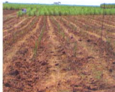
Canteiro de mudas