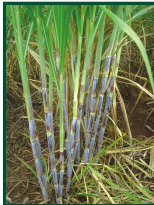
CVSO07-7870 - 6 meses

Com isso, a CanaVialis espera num futuro próximo ter as variedades mais bem adaptadas não só à região Oeste do estado de São Paulo, como também à todas as regiões canavieiras do Brasil.